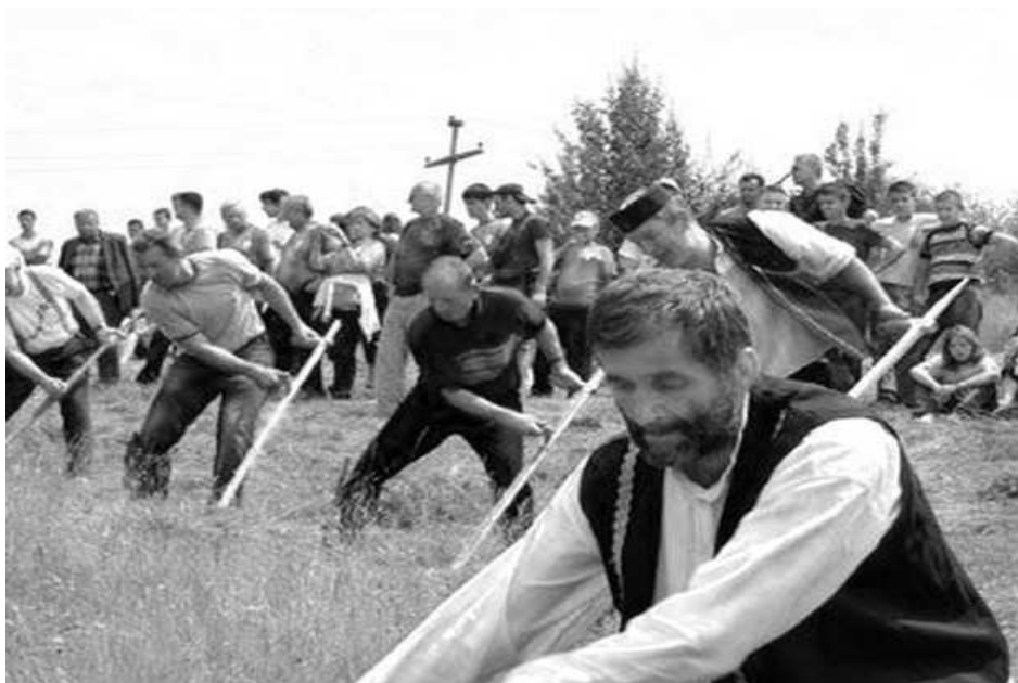
Косидба у Маровцу