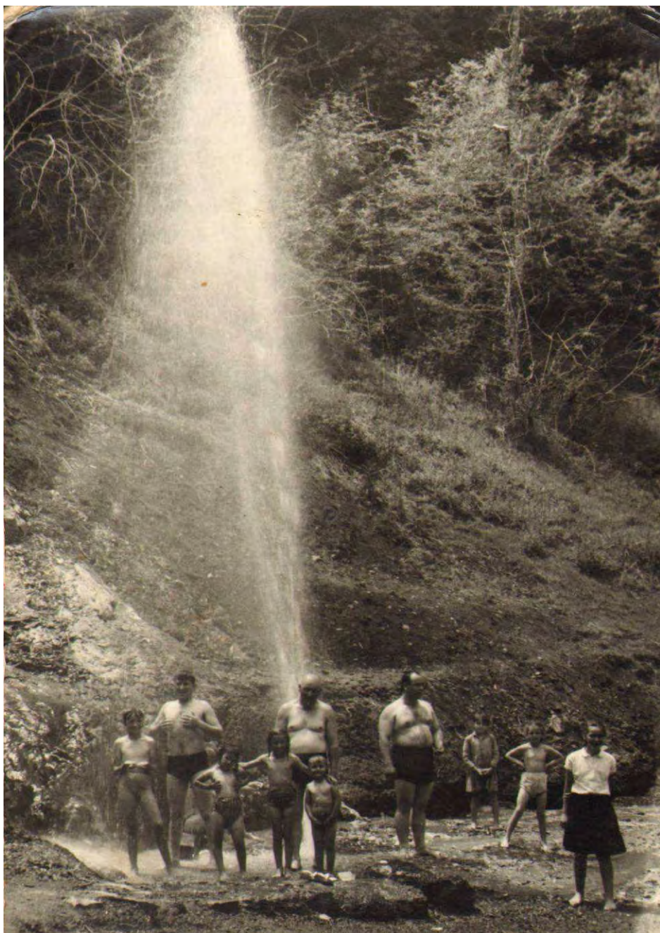
Стари Гејзир у Сијаринској Бањи