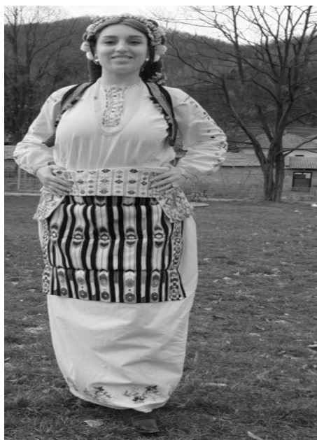
Албанка у традиционалној албанској ношњи