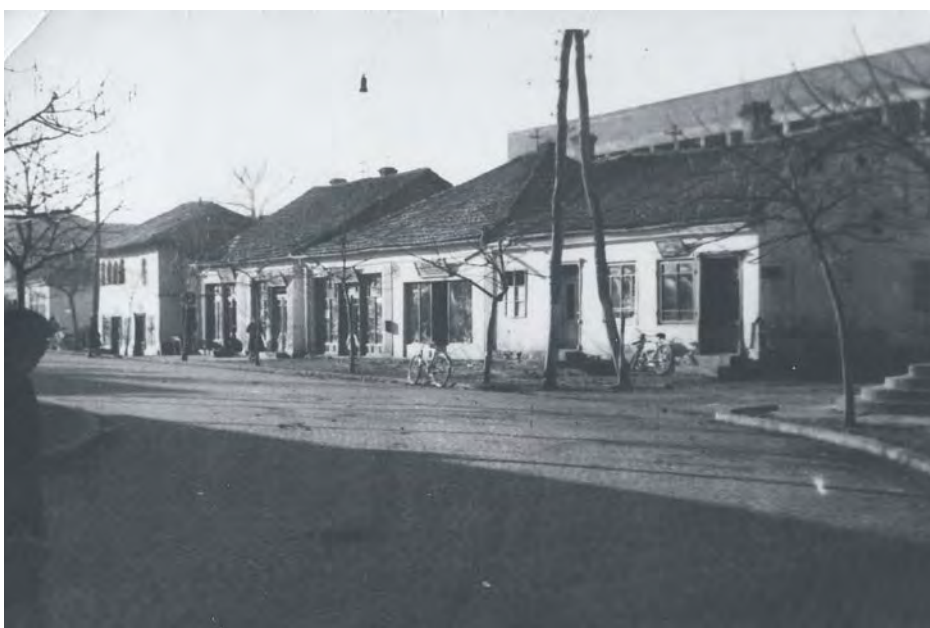
Центар Медвеђе – локали испред дирекције рудника