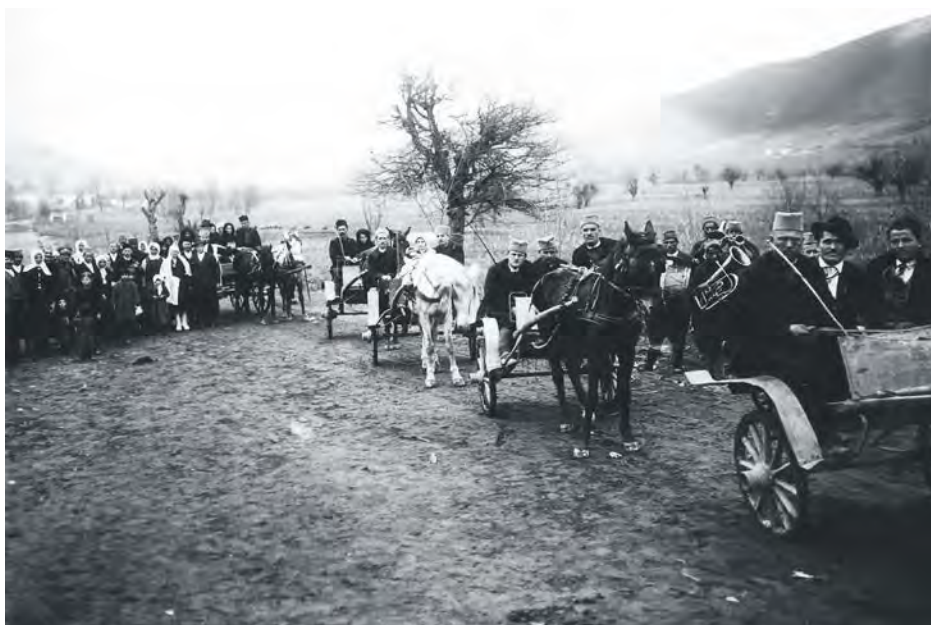
Свадбена окупљања 1920. – 1940.