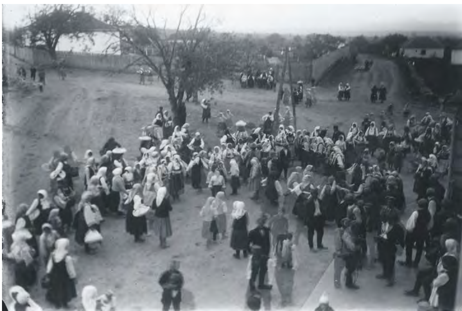
Свадбена окупљања 1920. – 1940.