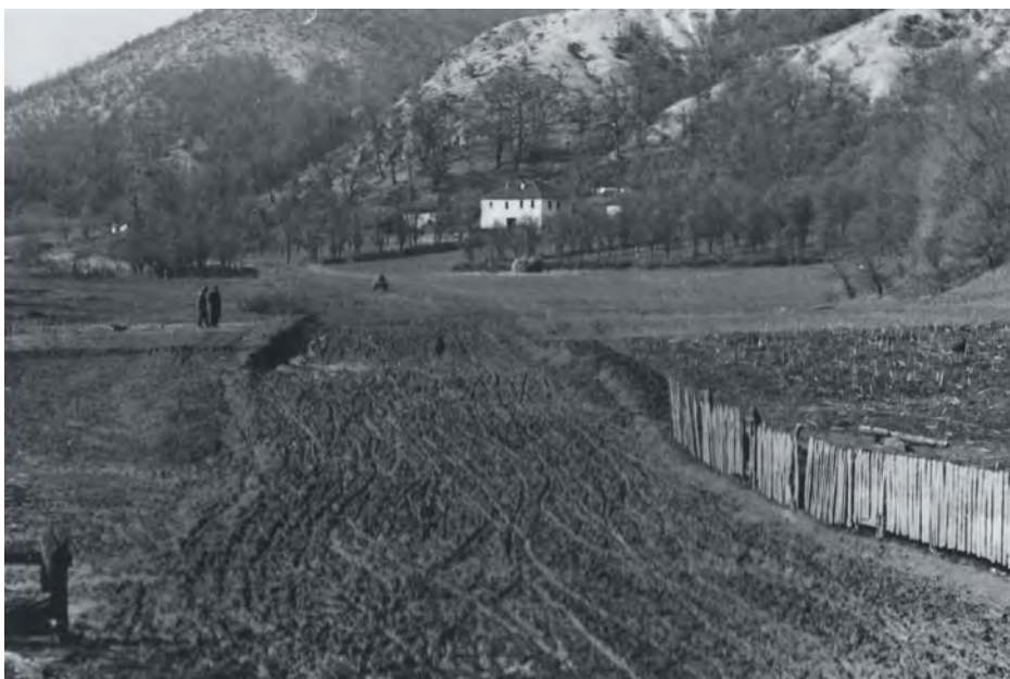
Путеви некад у Медвеђи