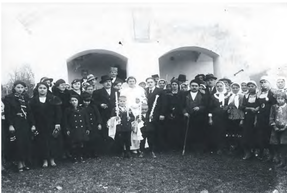
Свадбена окупљања 1920. – 1940.