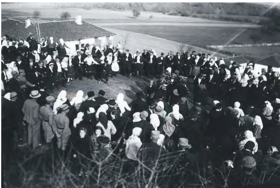
Сабор у Медвеђи 1932. године