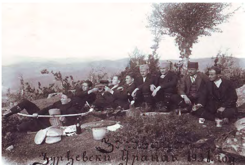
Ђурђевдански уранак 1931.