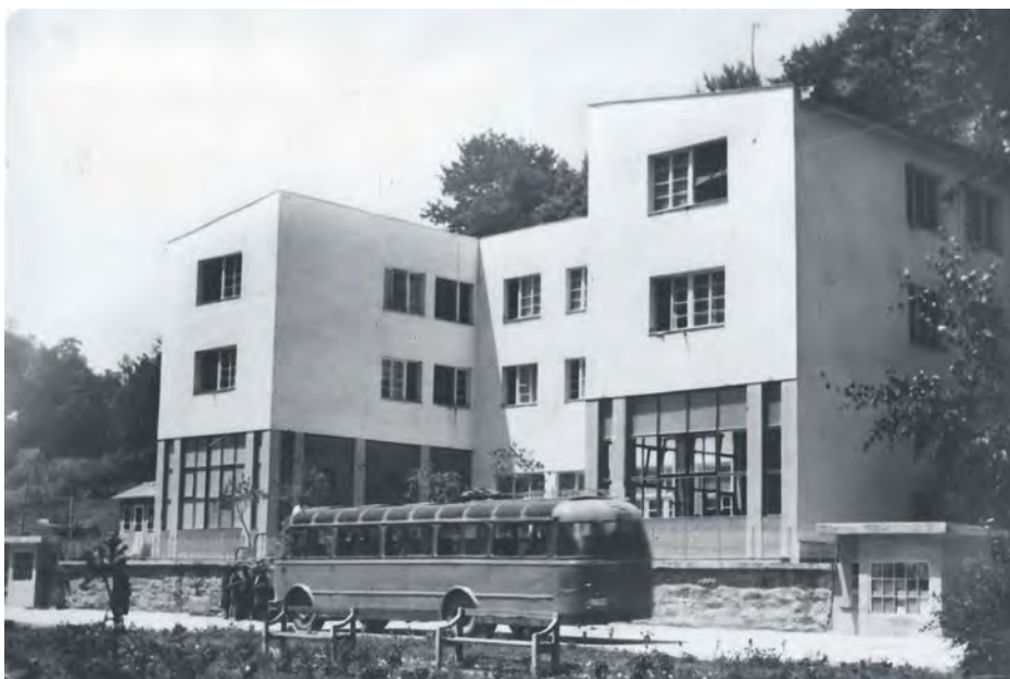
Хотел „Београд“ у Сијаринској Бањи