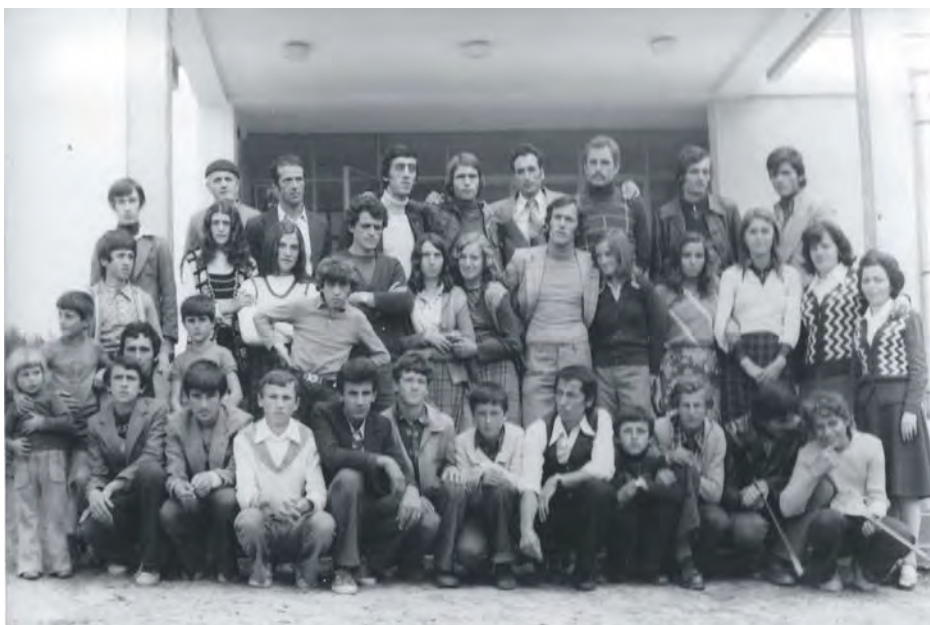
Ученици основне школе у Сијаринској Бањи 1960. – 1980.