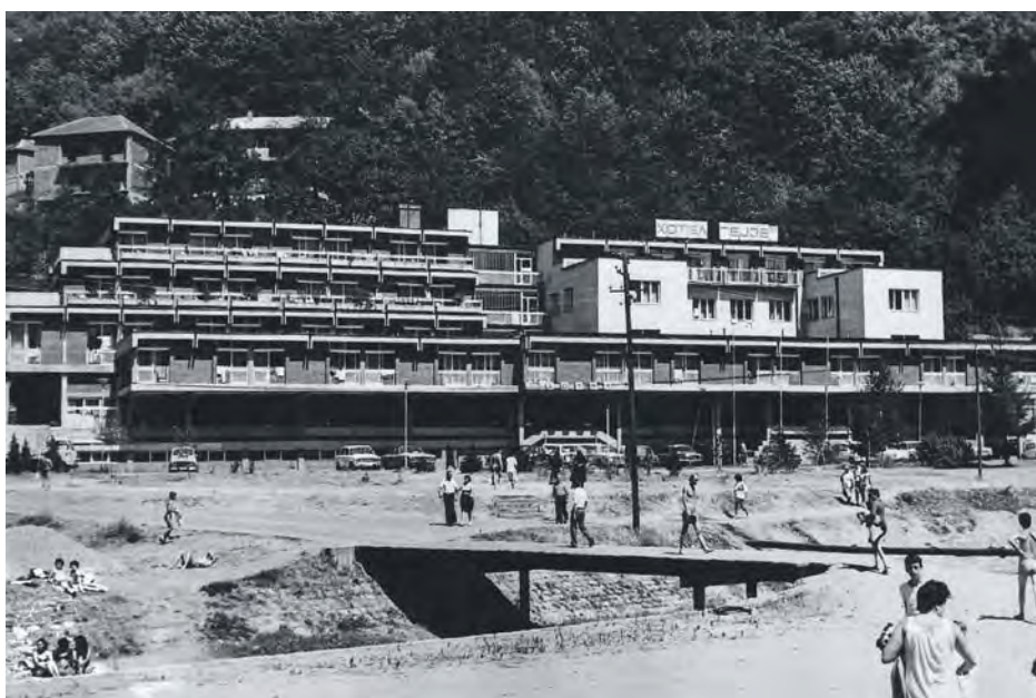
Стари хотел „Гејзер“ у Сијаринској Бањи