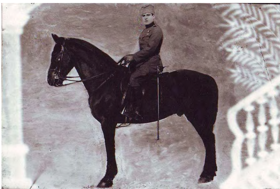
Коњаници 1920. – 1940.