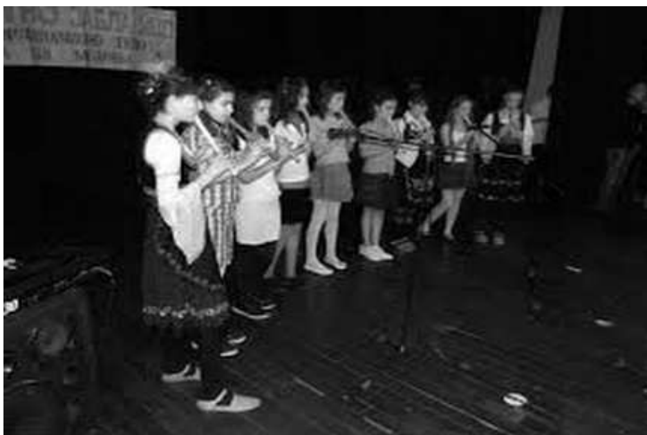
Дани фрулаша у Медвеђи