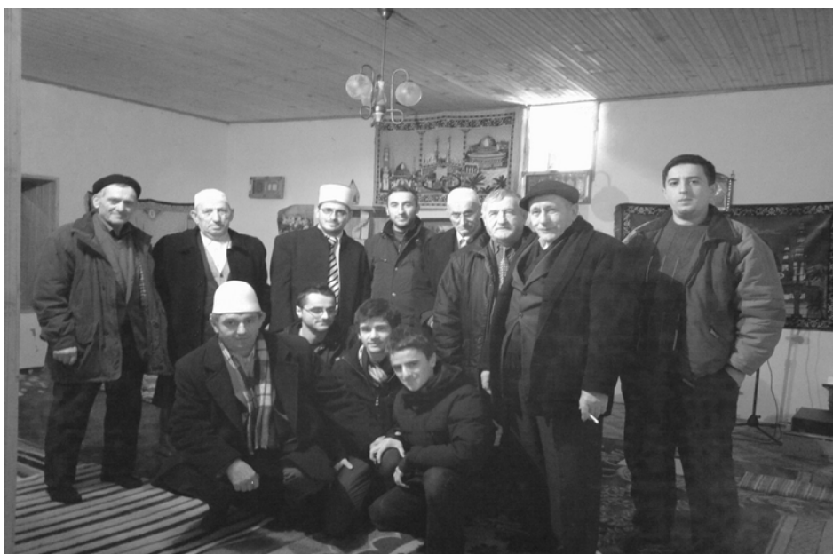
Окупљање верника у Цамији