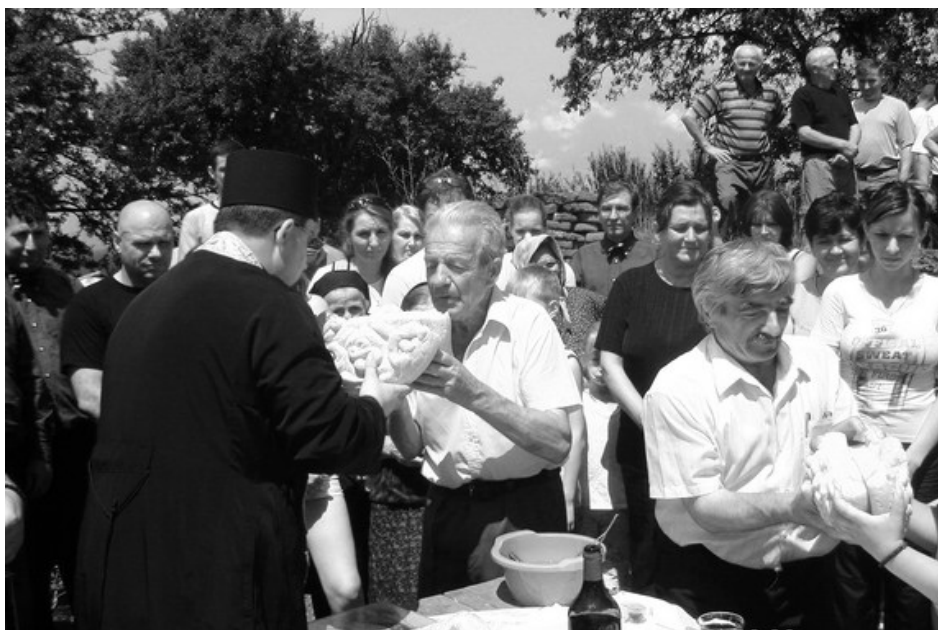
Обележавање сеоске славе