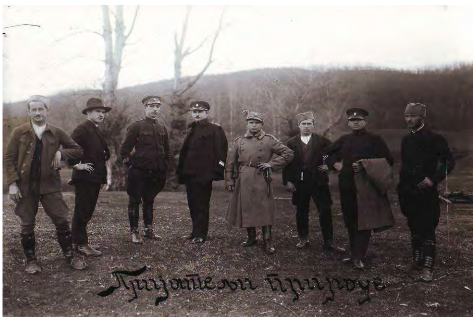
Излет у природу 1920. – 1940.