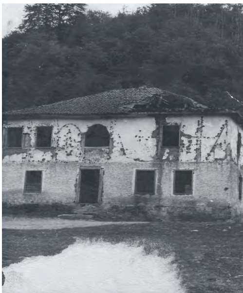
Исламска школа у Равној Бањи