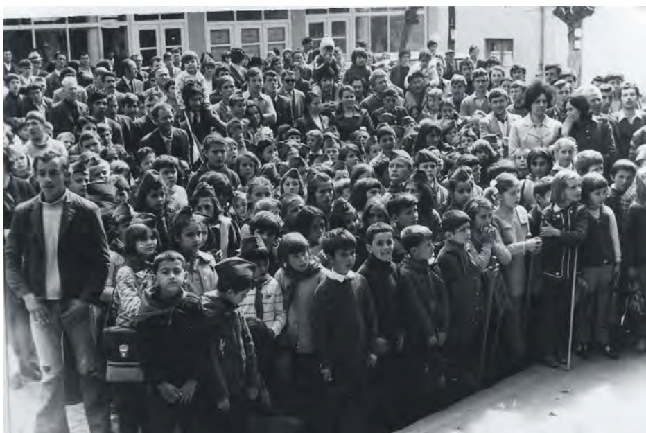
Окупљање испред зграде општине 70-тих година