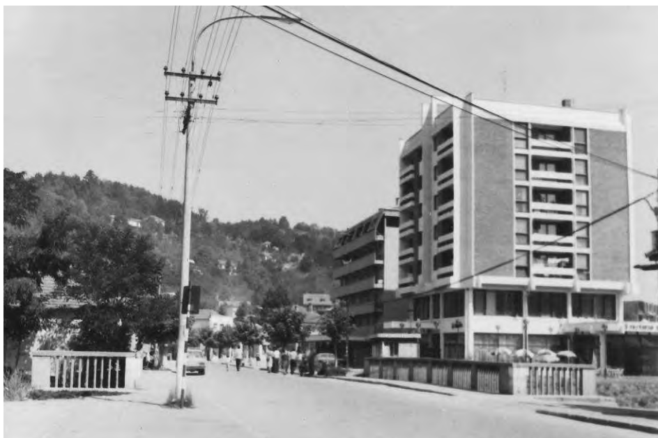
Стари мост у центру Медвеђе