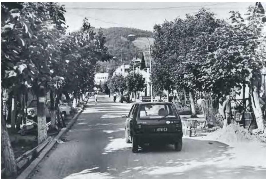
Дрворед у Медвеђи