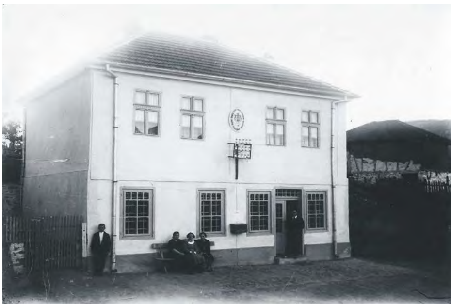
Прва пошта у Медвеђи