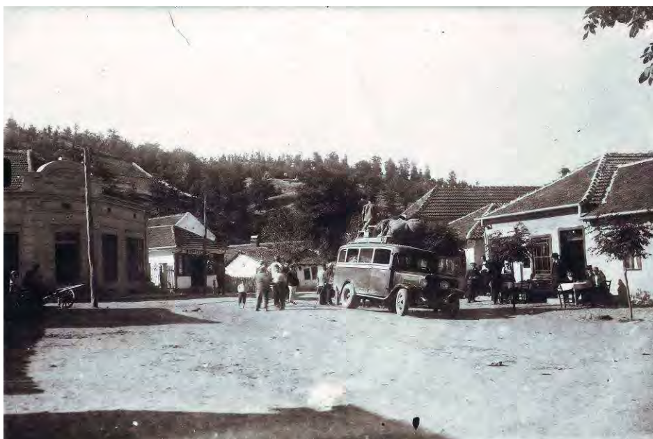
Центар Медвеђе – Стара чаршија