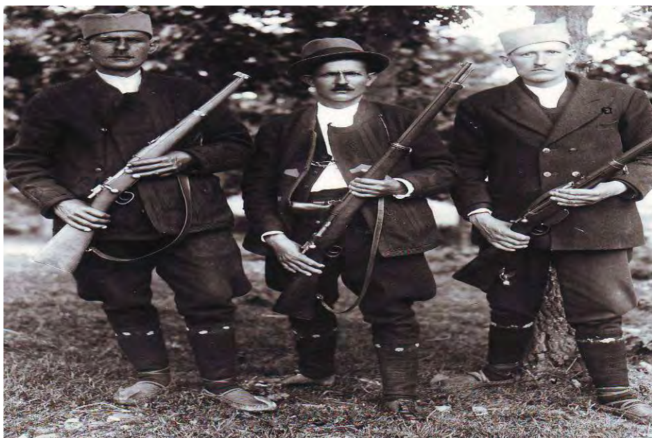
Мештани са оружјем