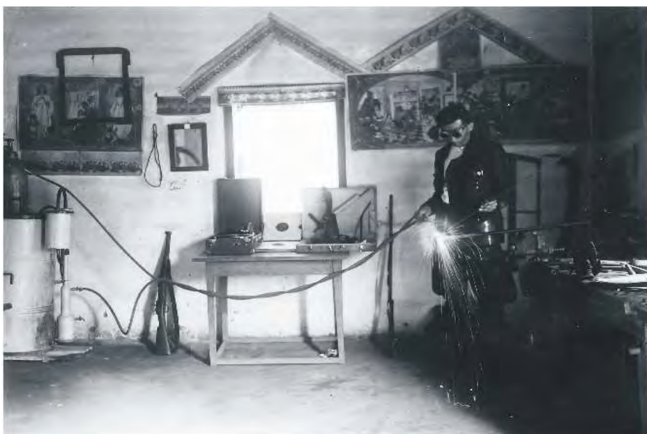
Мајстор – занатлија