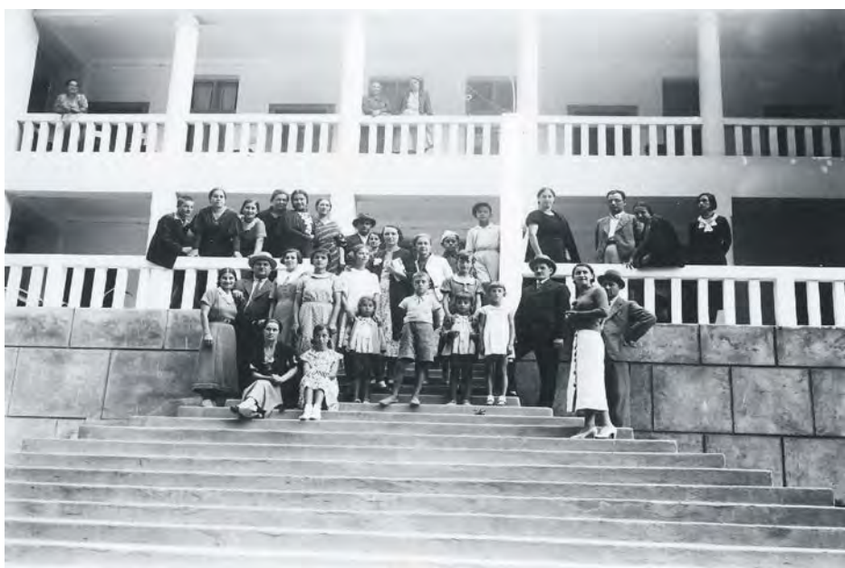
Фотографија испред једне од виле у Сијаринској Бањи