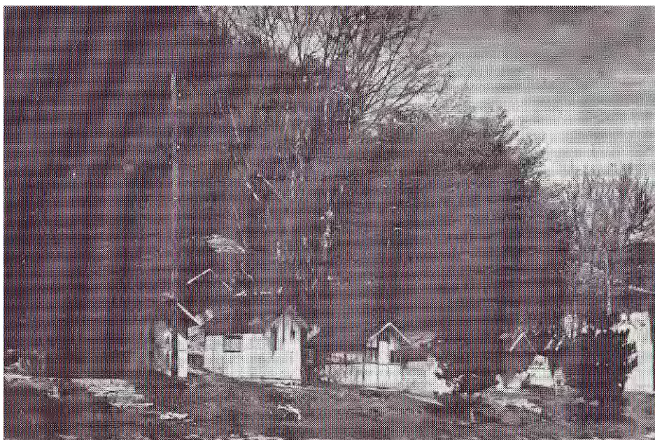
Камп насеље у Сијаринској Бањи 1965.