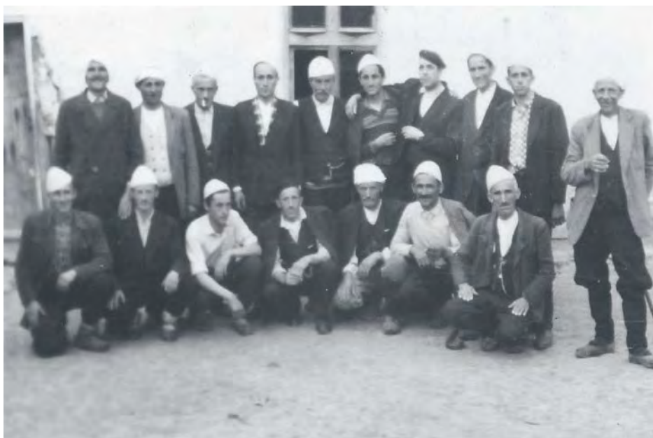
Градитељи пута Сијаринска Бања – Равна Бања