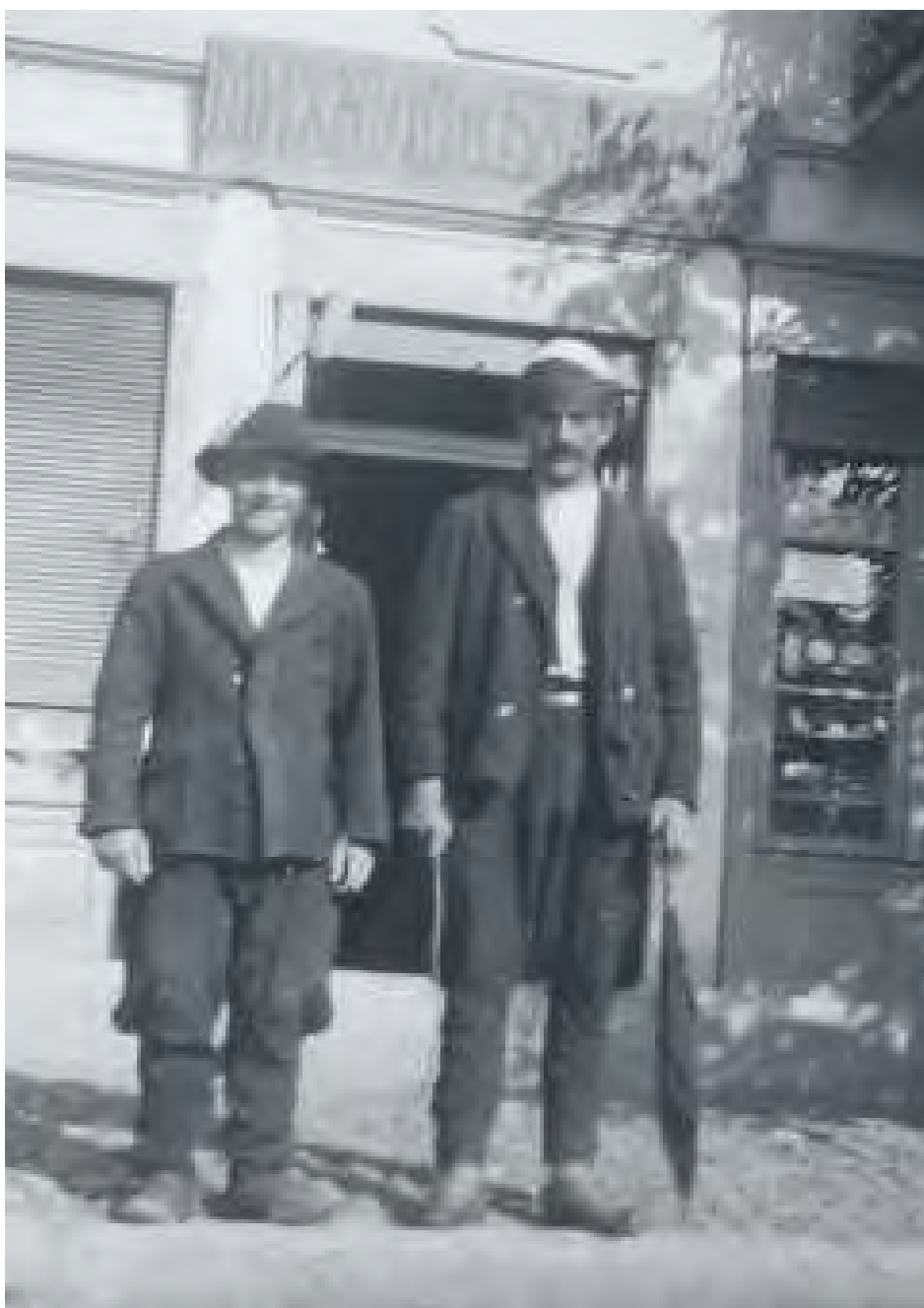
Србин и Албанац