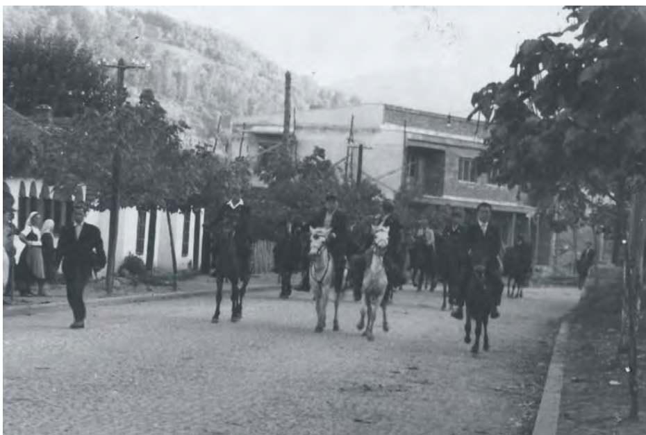
Коњаници у Медвеђу