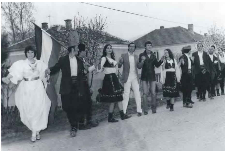
Суслрети села 1978. године