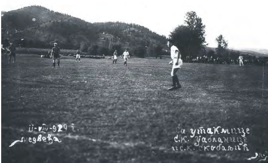
Утакмица СК „Јабланица и СК „Скобаљин“ 2. августа 1929.