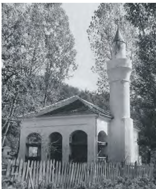
Џамија у Сијаринској бањи