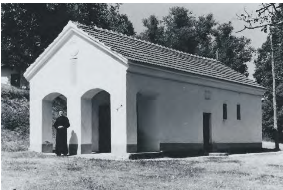
Црква у Медвеђи, фотографија пре обнове