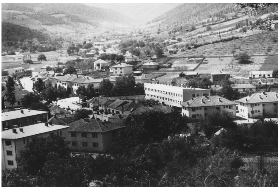
Панорама Медвеђе – снимано са споменика