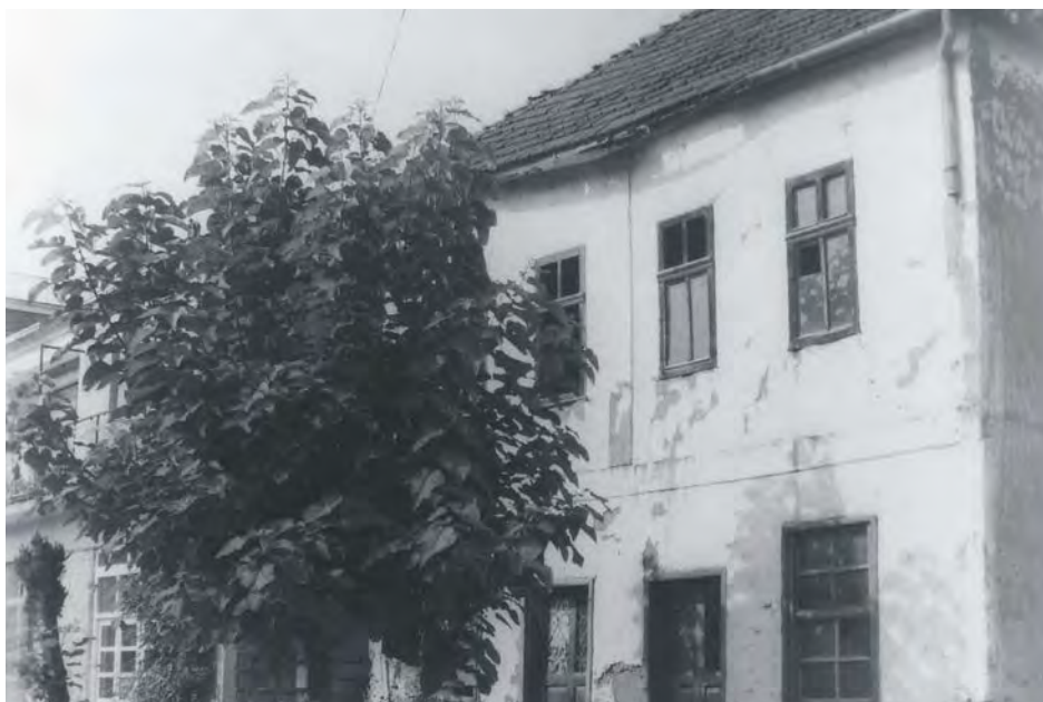
Стара кућа са локалом у приземљу