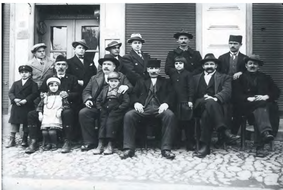
Окупљања занатлија и трговаца Медвеђа 1920 - 1940.