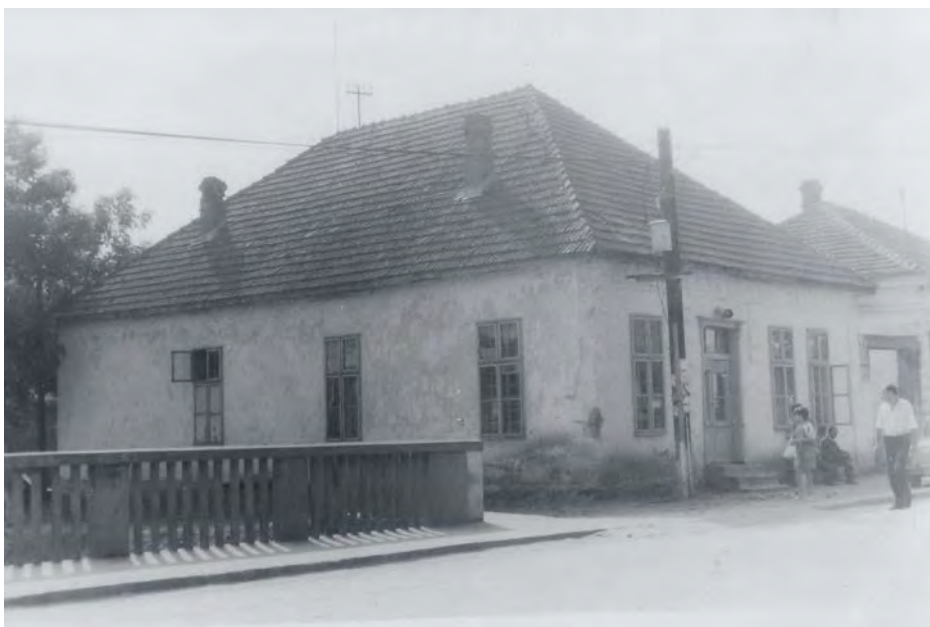
Кућа поред моста у центру Медвеђе