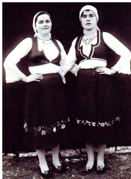
Српска народна ношња