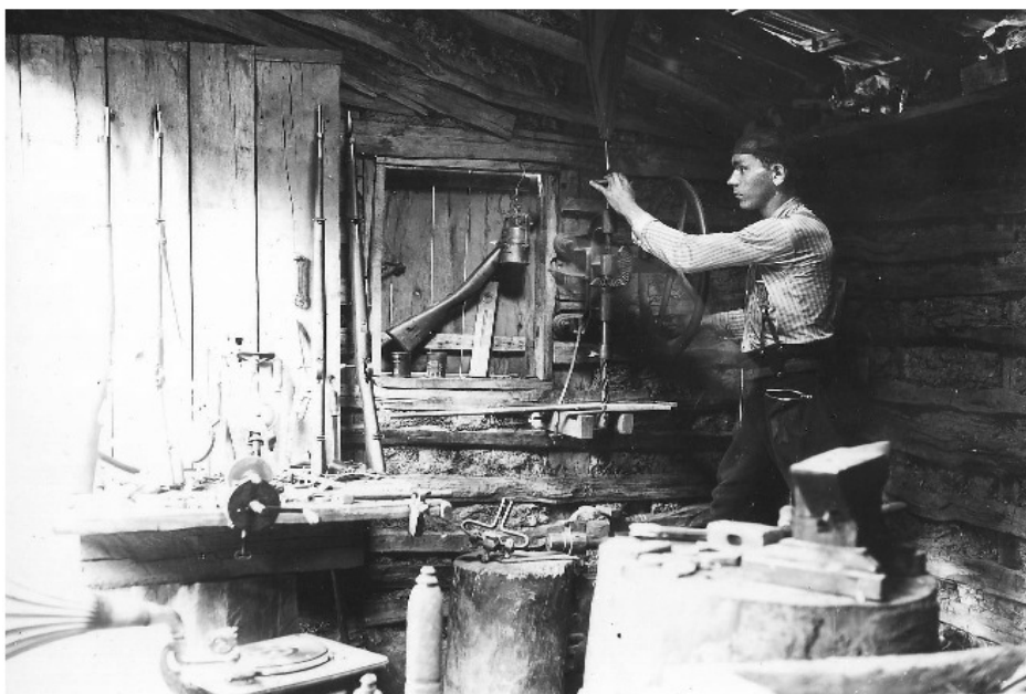
Мајстори – занатлије