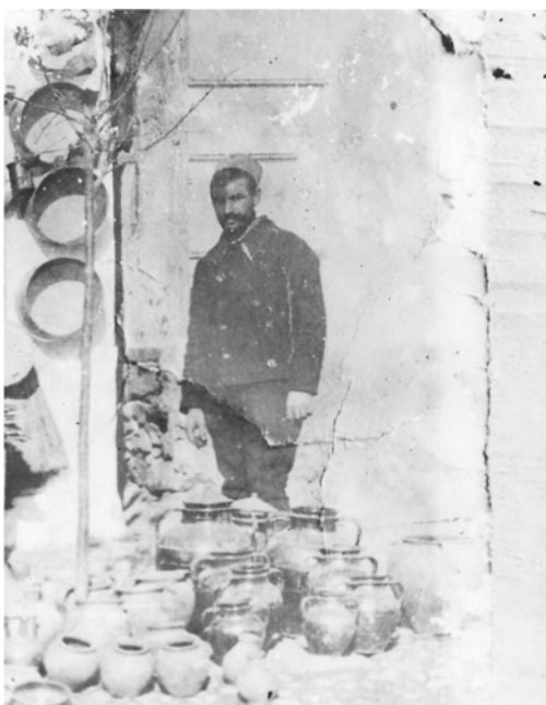
Старе занатлије – кројач и грнчар