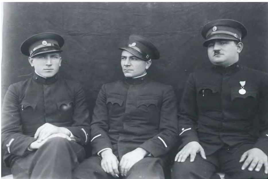
Службеници у Медвеђи 1920. – 1940.