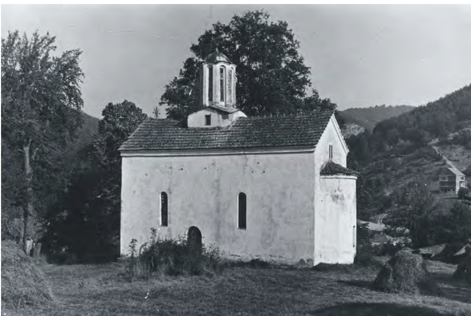
Црква у Тулару, фотографија пре обнове