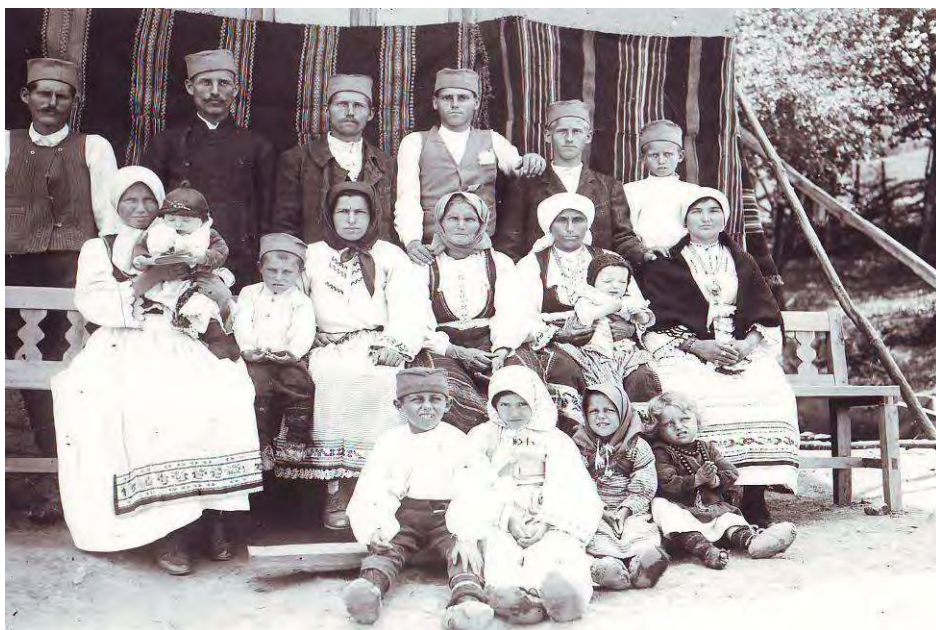
Косовска ношња пећанаца