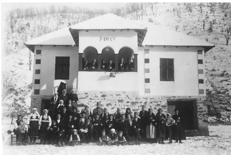
Испред виле у Сијаринској Бањи 1935. године