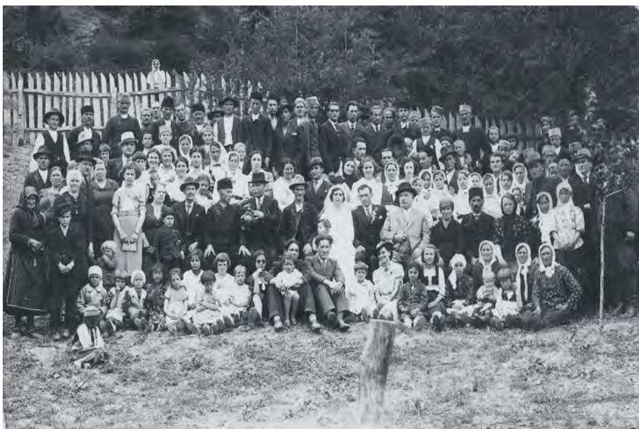
Свадбена окупљања 1920. – 1940.