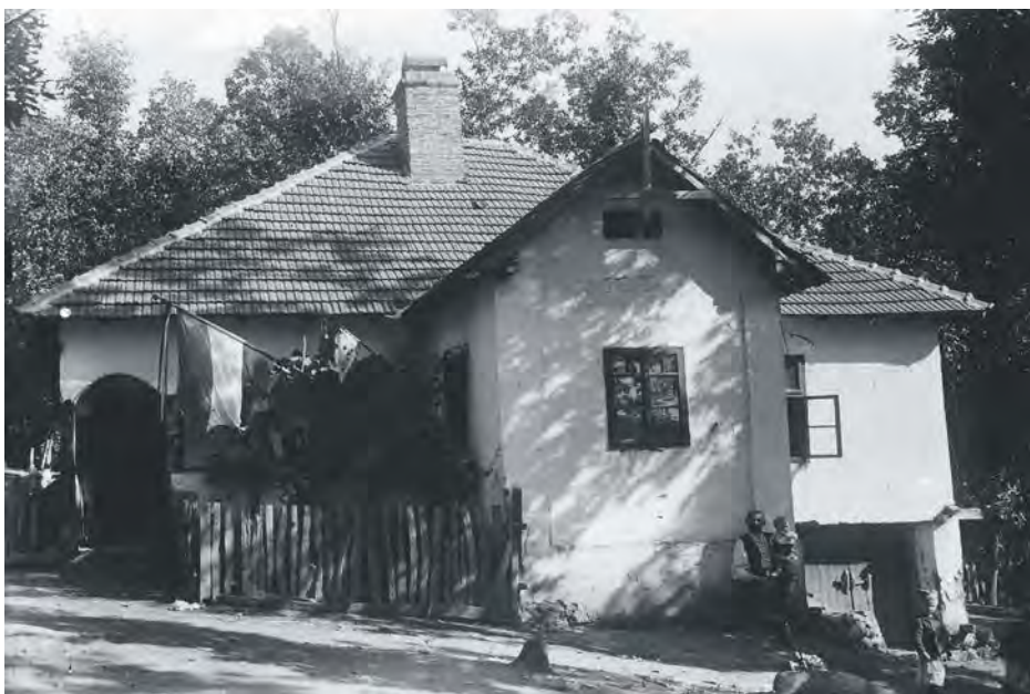
Основна школа у Сијаринској Бањи 1940.