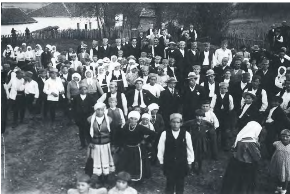
Свадбена окупљања 1920. – 1940.