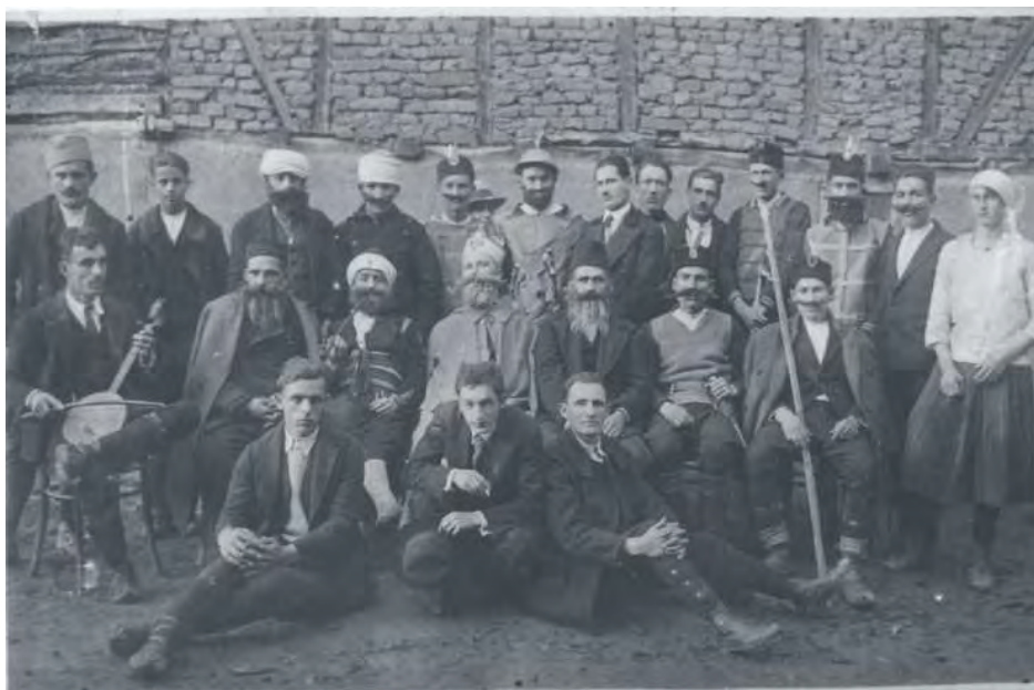
Празник Бела недеља 1932. године у Медвеђи