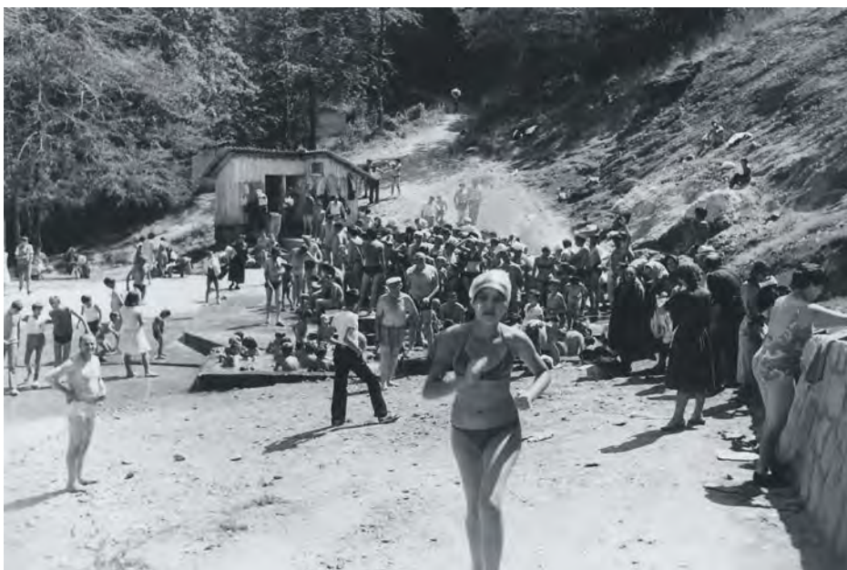
Гејзир у Сијаринској Бањи