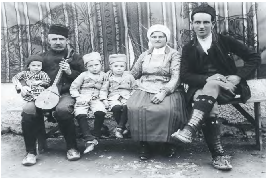
Гуслар са својом породицом