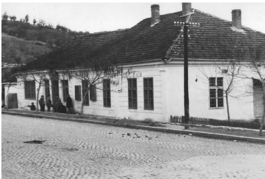
Центар Медвеђе – стара кафана