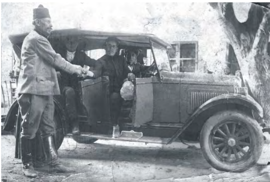
Први аутомобил у Медвеђи