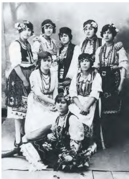
Градска ношња 1920. – 1940.