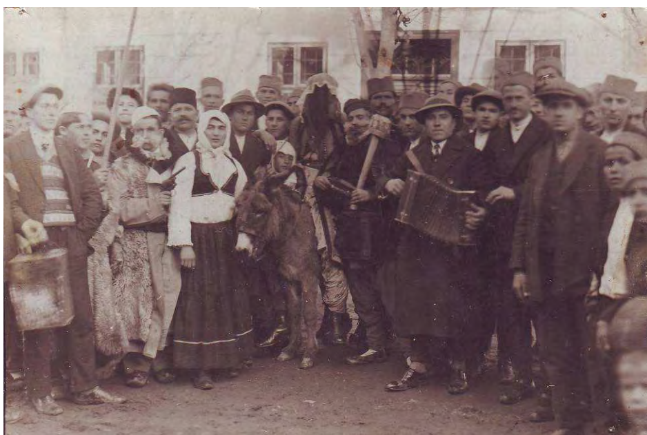
Гостовање уметничке групе из Нове Тополе 1936.