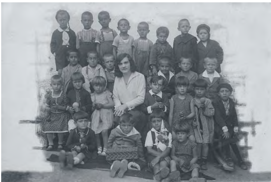
Забавиште 1931. године