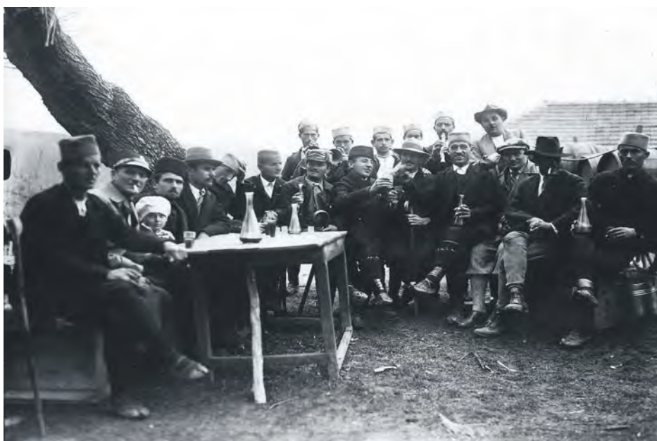
Окупљања занатлија и трговаца Медвеђа 1920 - 1940.