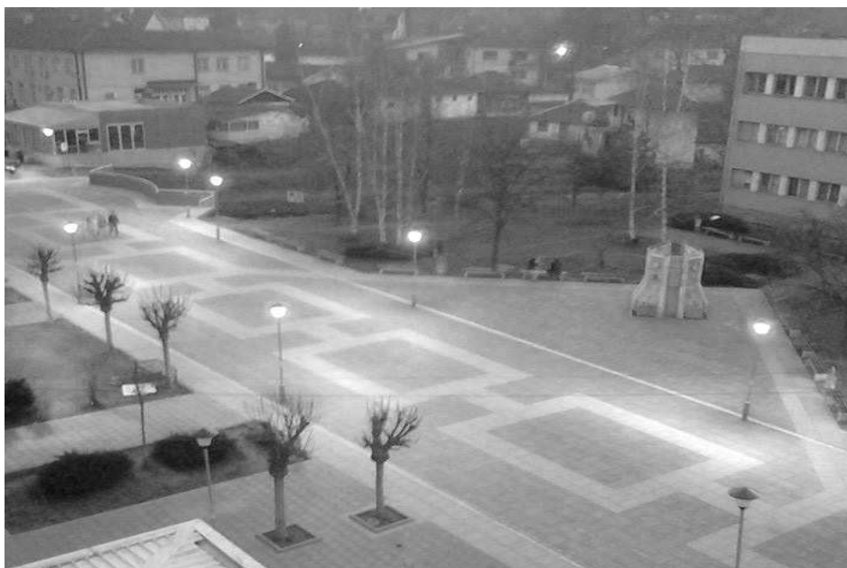
Данашњи изглед центра Медвеђе