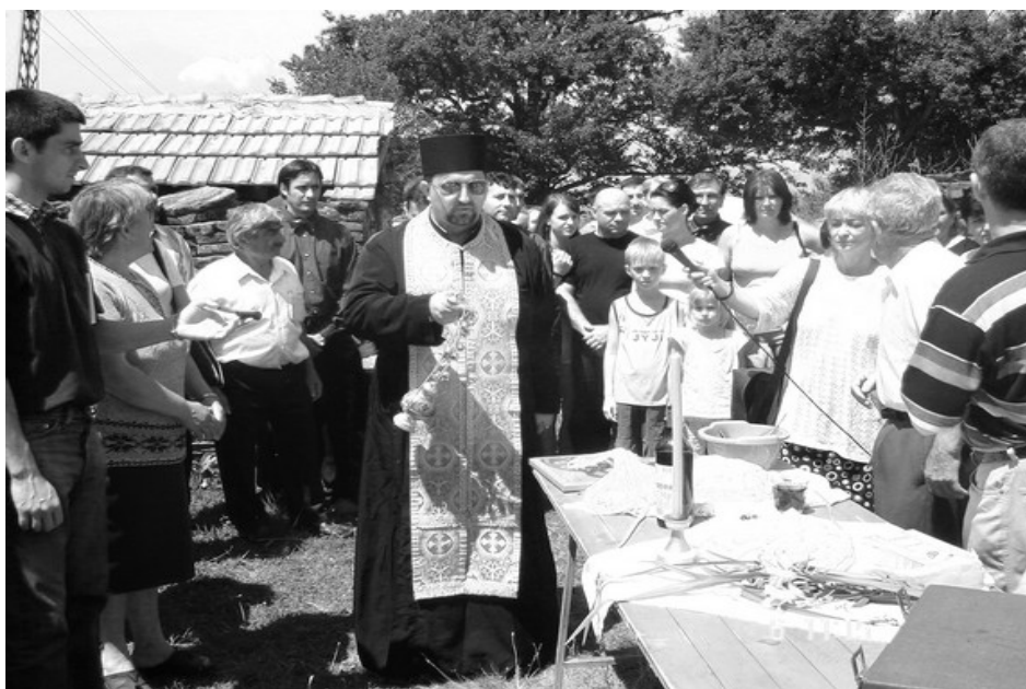
Обележавање сеоске славе