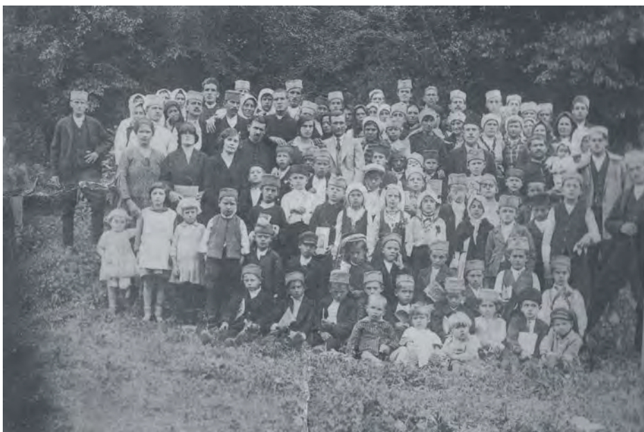
Ученици основне школе у Сијаринској Бањи 1934.