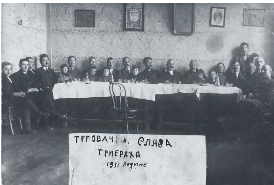
Трговачка слава Три јерарха 1931. године