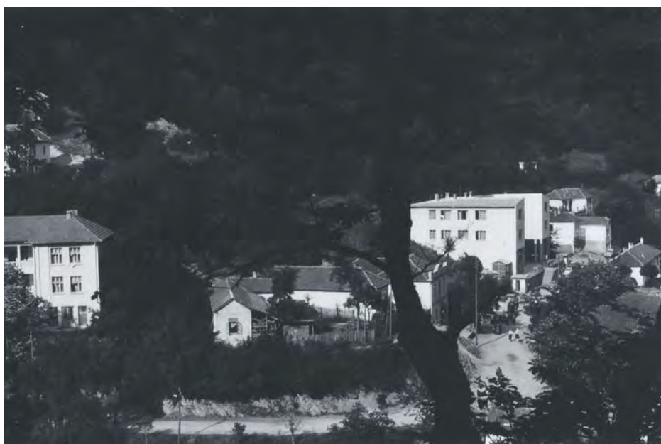
Хотел „Београд“ у Сијаринској Бањи