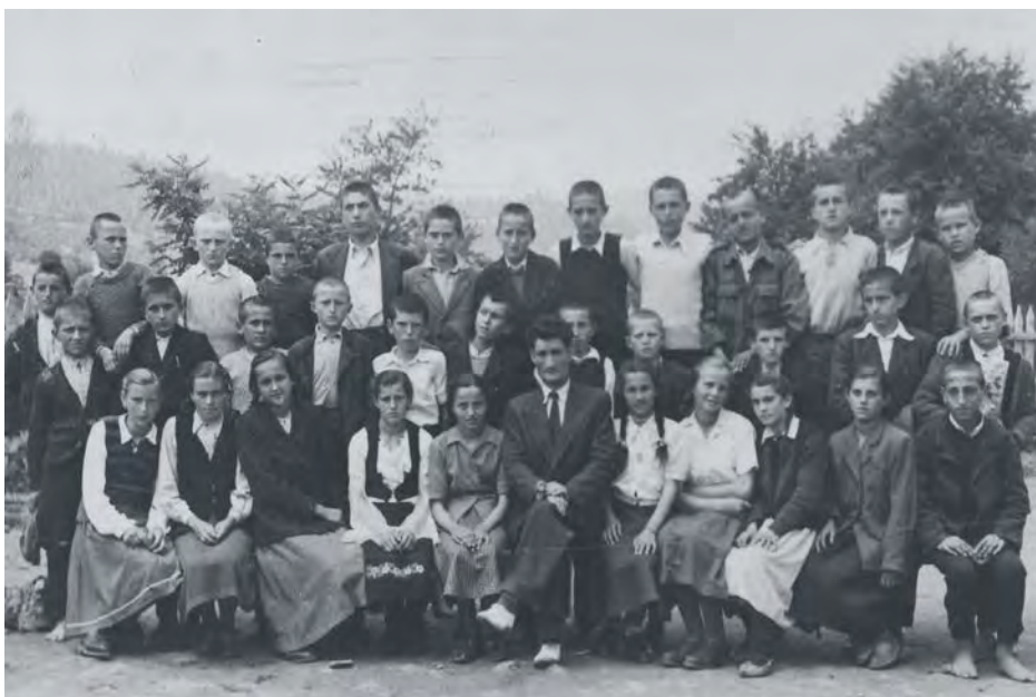
Ученици основне школе 1951. – 1956.