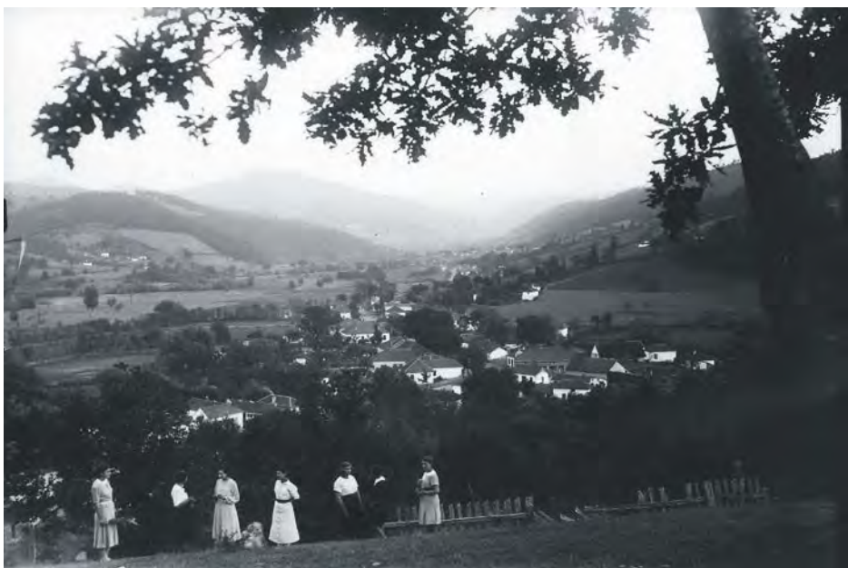
Панорама Медвеђе са брда код споменика