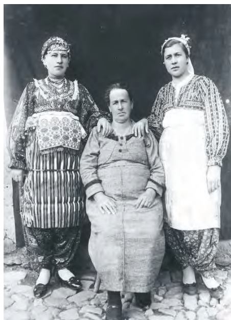
Албанска народна ношња