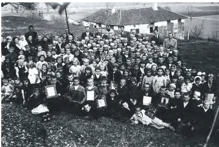
Прва основна школа у Медвеђи