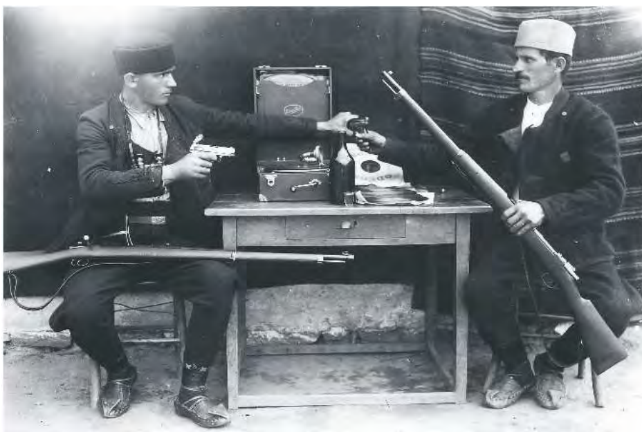
Мештани са оружјем