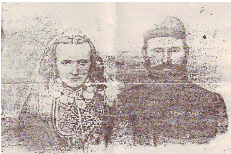
Први свештеник у Горњој Јабланици и његова жена