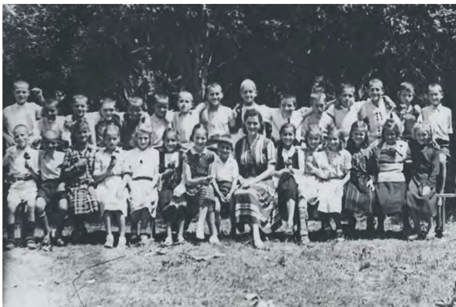
Ученици основне школе 1951. – 1956.