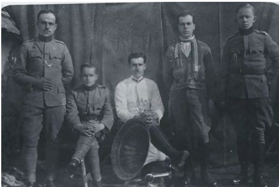
Службеници у Медвеђи 1920. – 1940.