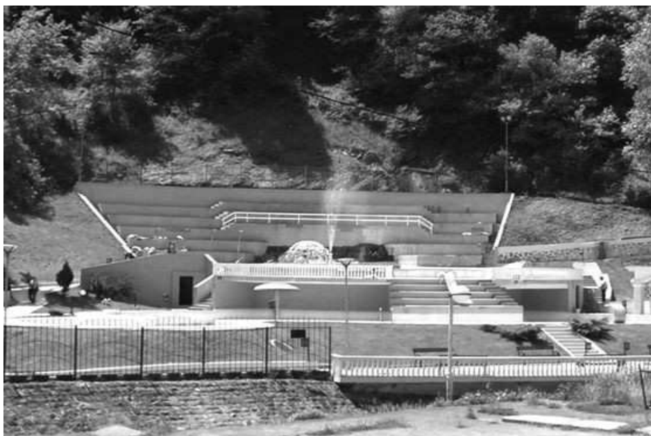
Данашњи изглед гејзира у Сијаринској Бањи