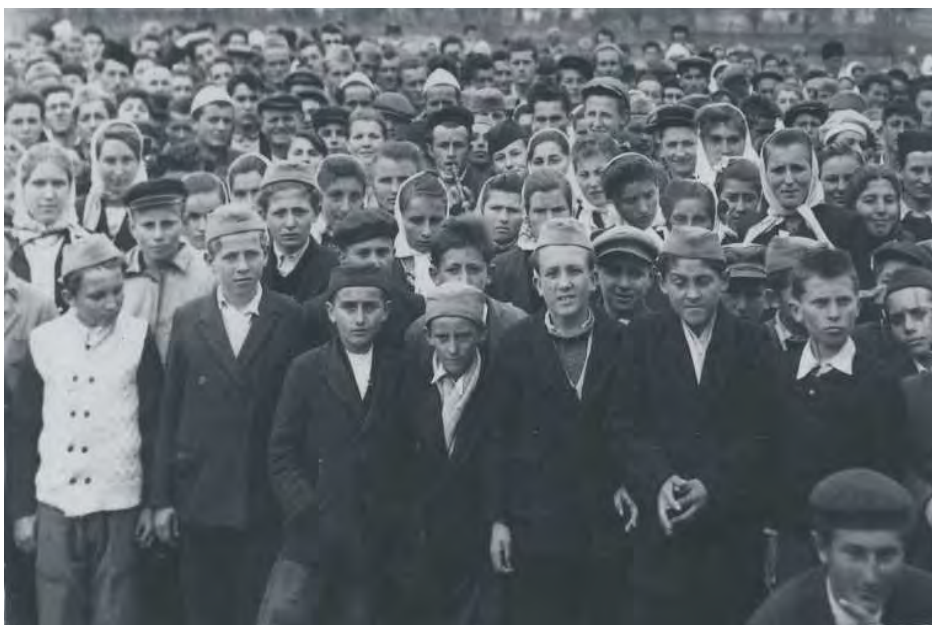
Омладина Медвеђе 1946. године